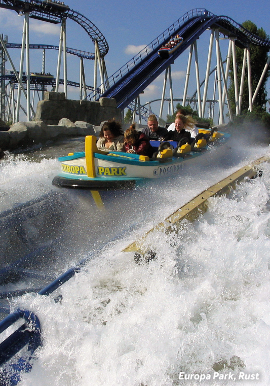
Europa Park, Rust