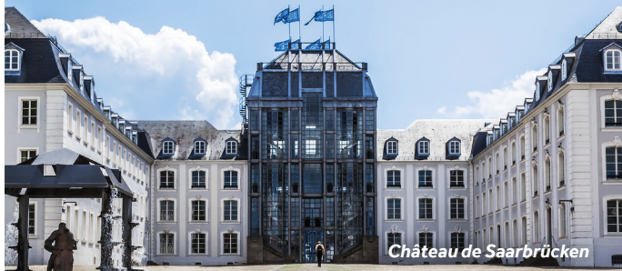
Château de Saarbrücken