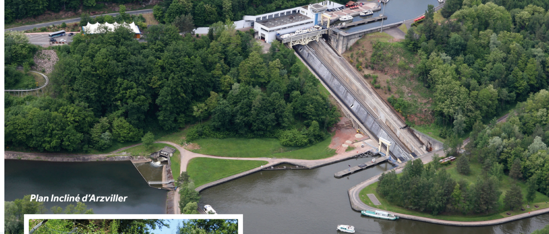
Plan Incliné d'Arzviller