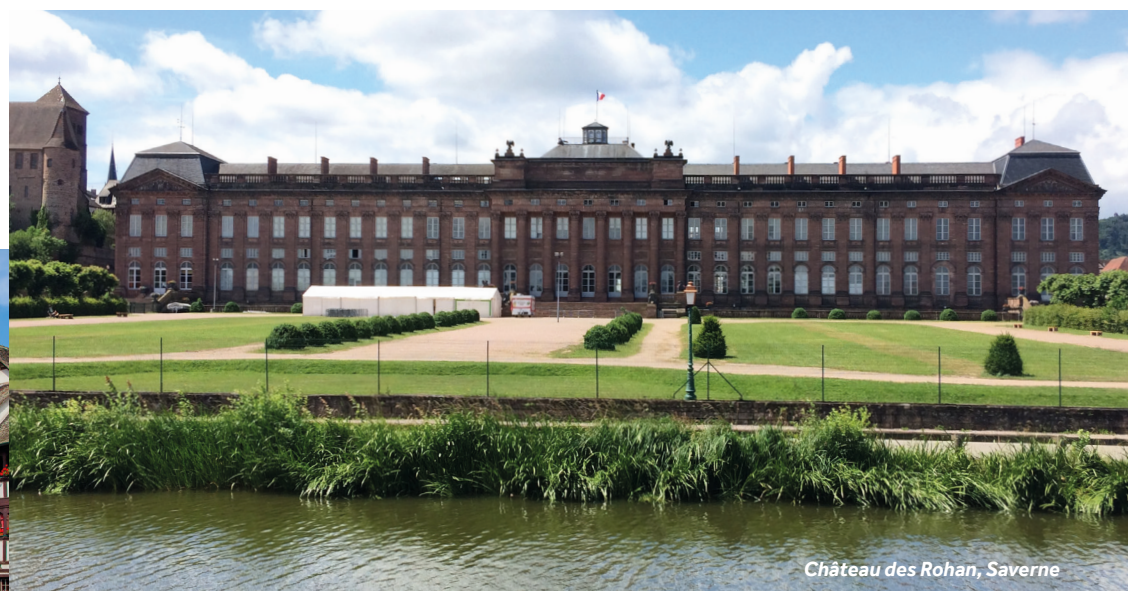
Château des Rohan, Saverne

Amarrages : au PK 286 avec juste de l'eau.