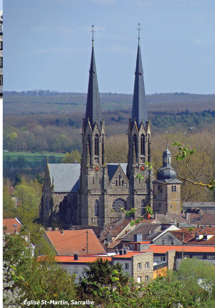
Église St-Martin, Sarralbe

Amarrages : à la marina Osthafen (eau et électricité) ou au port de la ville.