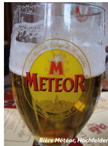
Bière Météor, Hochfelden

Amarrages : à 15-20 min à pied du centre-ville. Le seul port est situé Quai des Belges, avec eau et électricité.