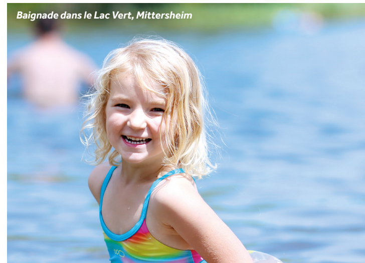
Baignade dans le Lac Vert, Mittersheim

Amarrages : quai (pas de bornes d'eau ni de branchements électriques).